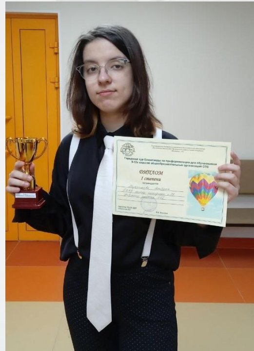
2023-2024 учебный год