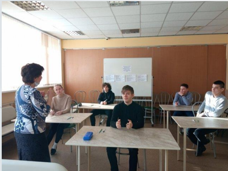
2020-2021 учебный год