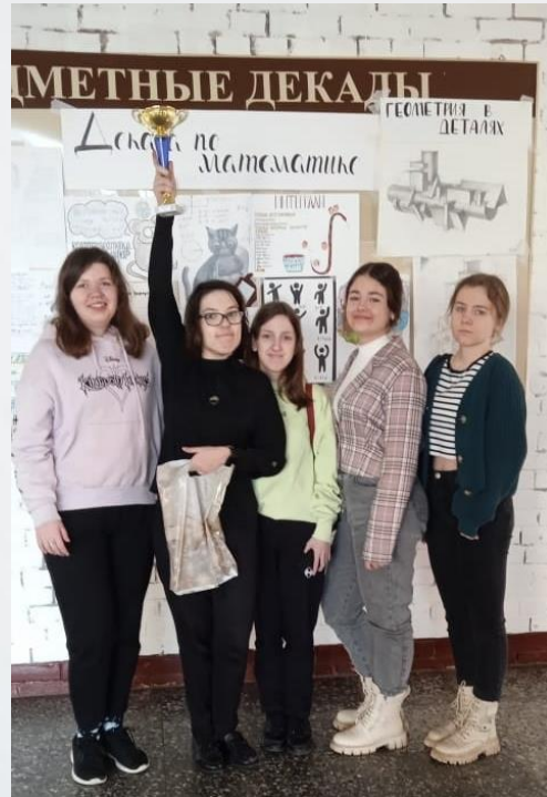
2022-2023 учебный год