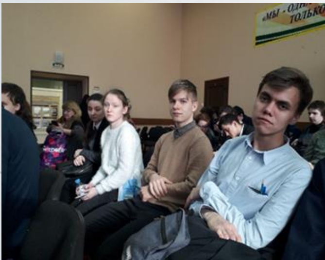
2019-2020 учебный год