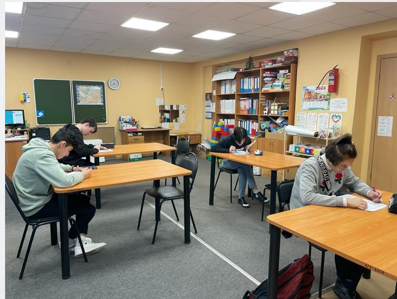
2022-2023 учебный год