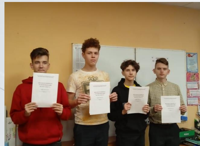
2023-2024 учебный год